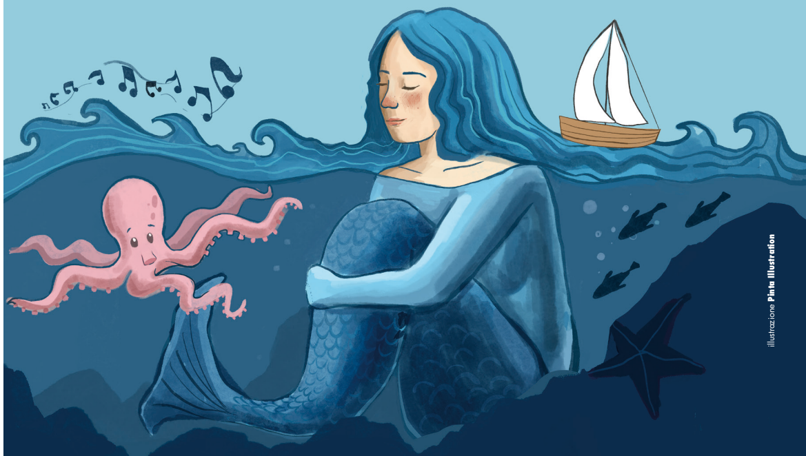
illustrazione Pinta Illustration